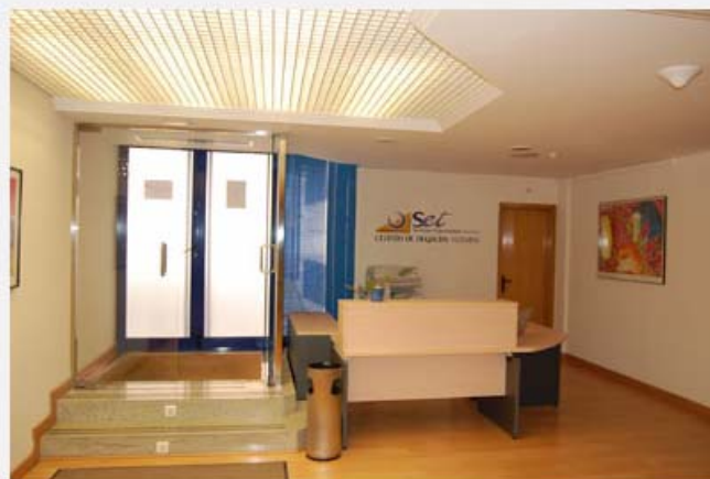
El centro de negocios Tenerías ofrece despachos completamente equipados, amueblados y configurables a la medida de las necesidades de cada cliente.